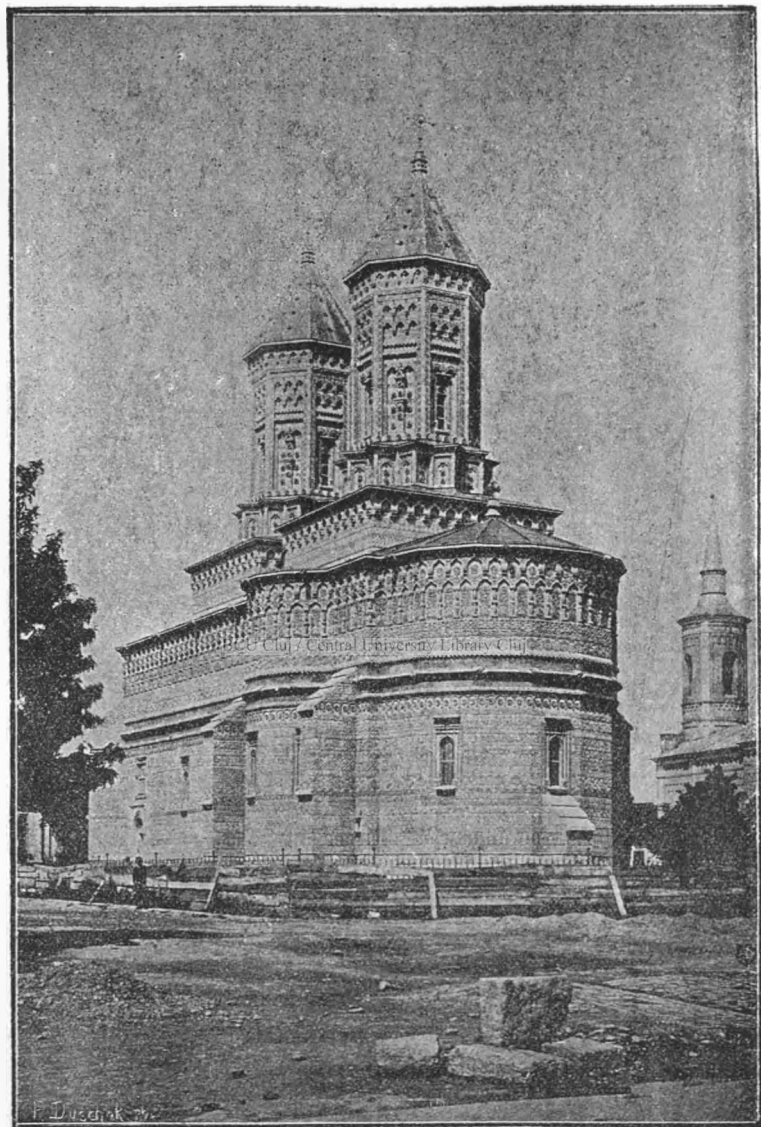
Biserica Trei Ierarhi din Iași.