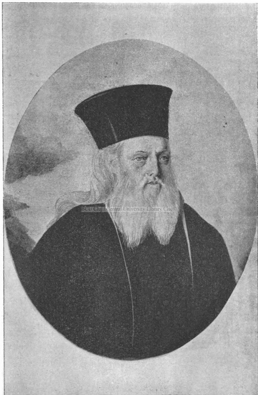
MITROPOLITUL VENIAMIN (după un portret dat de el Căpitanului Constantin Costachi; astăzi în posesiunea d-lui Lupu Costachi.)