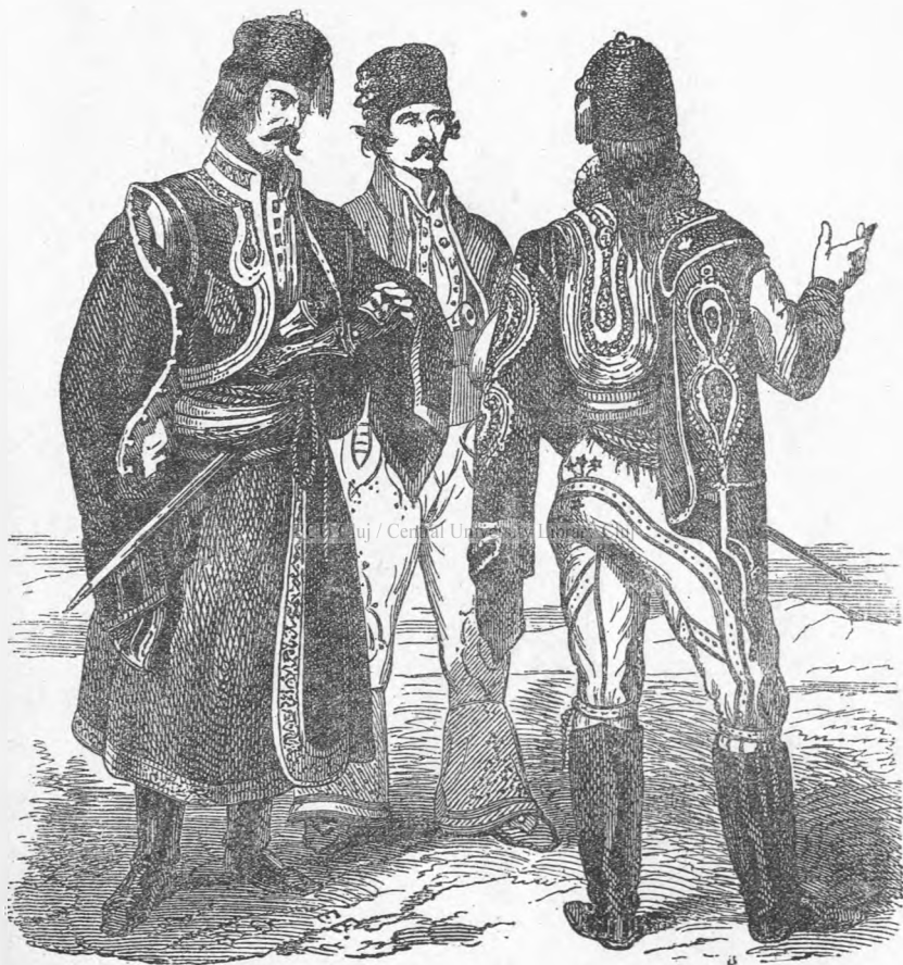
DOROBANȚI (După Bouquet).