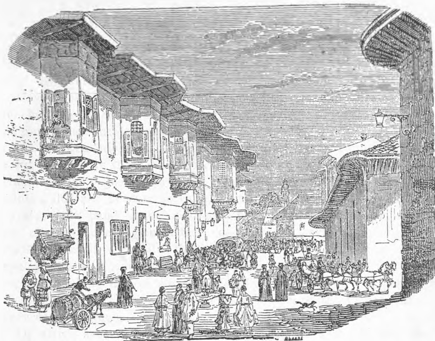
STRADĂ DIN BUCUREȘTI (după Doussault).