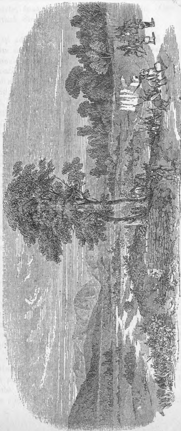
(GRANIȚA PRUTULUI ÎN 1830 (după același)).