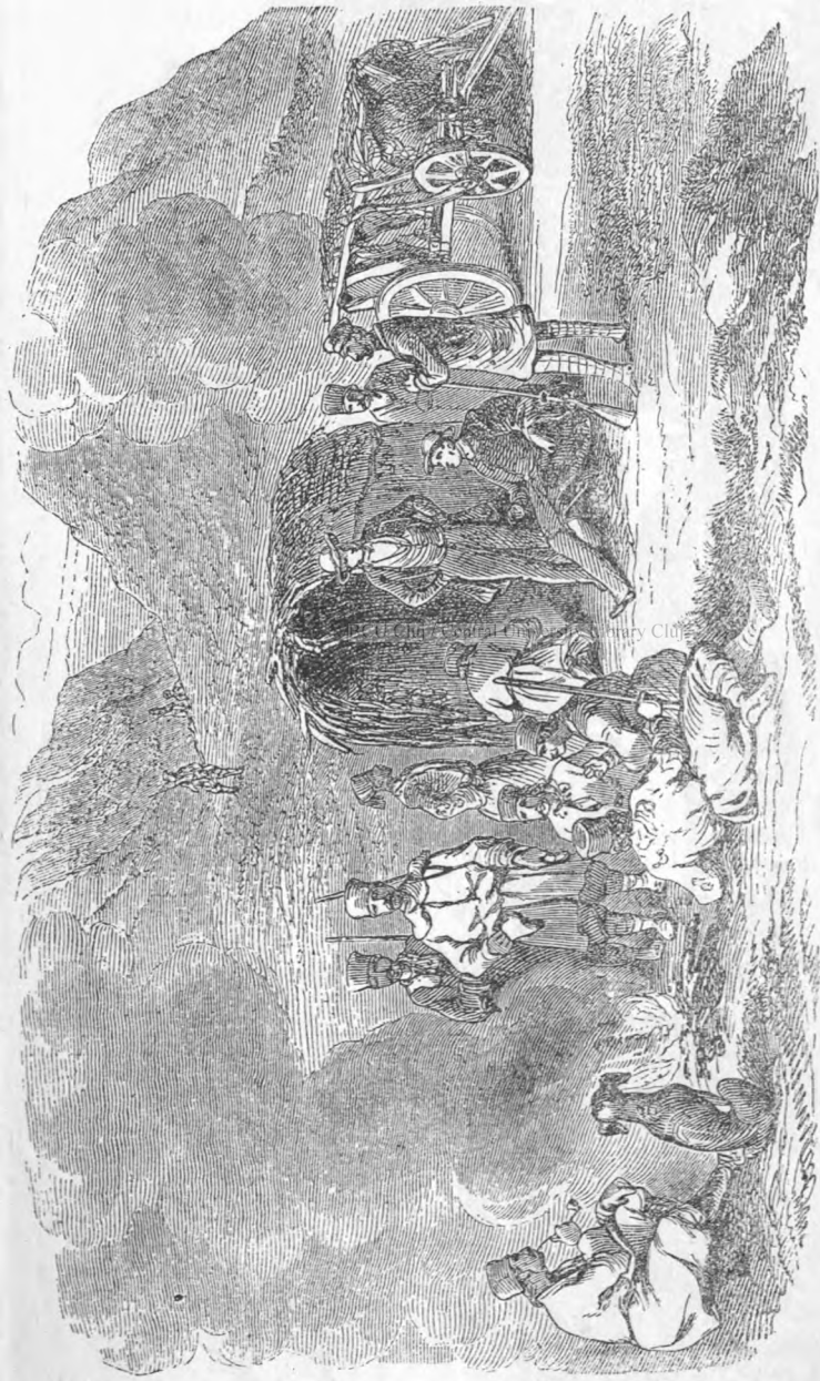
L.A. VINAT (după Doussault).