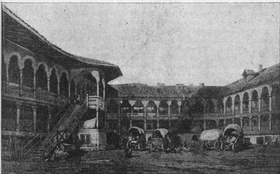
HANUL LUI MANUC DIN BUCUREȘTI (după Bouquet). ]