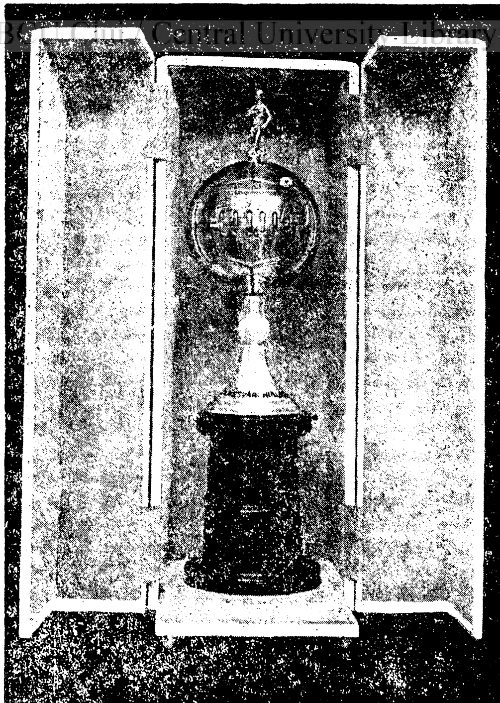
A Temesvári Hirlap vándordíja, amelyért legközelebb megkezdődnek a küzdelmek

Belgium bajnokságai. A bel- ga bajnokságokat vasárnapon rendez- ték meg Lüttichben. Két új férfi és két új női rekord volt a nap eredménye. 200 méter: Zinner 22.6 mp. 800 méter: Coen- jaerts 2 p 00.9 mp. 10 km: Degrande 33 p 03.7 mp (belga rekord). 400 m gátfu- tás: Migiot 60.8 mp. Diszkoszdobás: Delaender 37.05 méter. Rudugrás: Hen- rigean 3.60 m. 4x200 méter: FC Lüttich 1 p 30.4 mp (belga rekord). A hölgyek