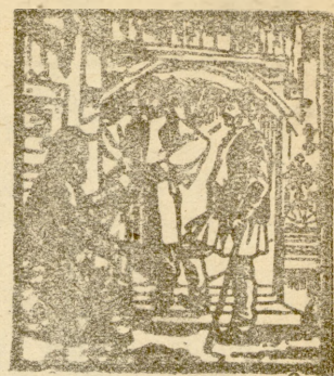
„Țineți cu poporul ca să nu răătăciți!”

LA MAI VECHIE FOAIE POPORALĂ, ÎNFIINȚATĂ ÎN ANUL 1892