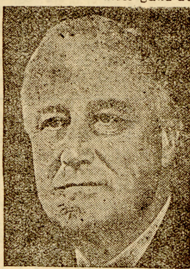
† Franklin Dellano Rosevelt

roși a ne primi de partea lor, dându-ne asigurări, că ne vom recăpăta provincia răpită a Transilvaniei de