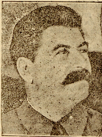
Iosif Visarionovici Stalin