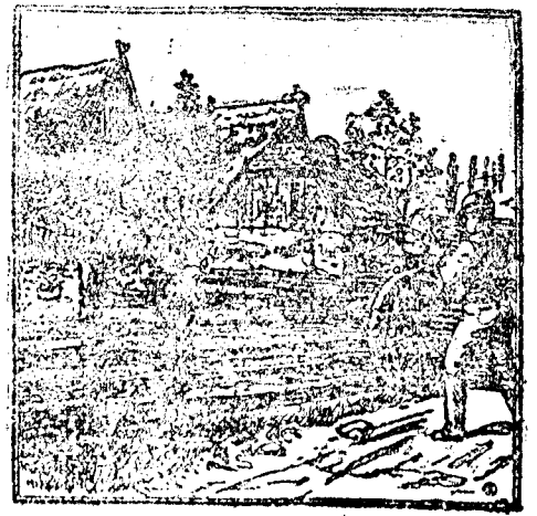
Ce va să zică chipul acesta? Aflați!