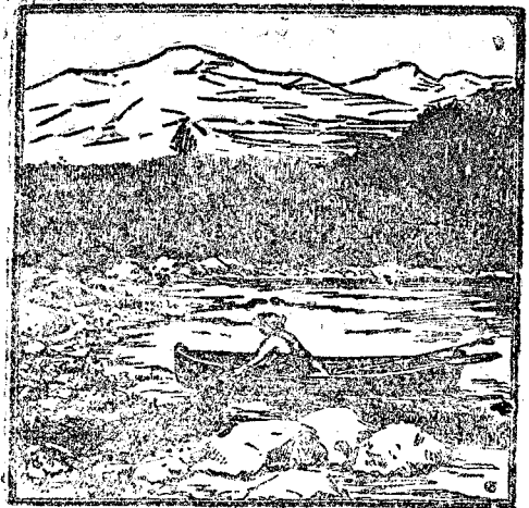
Ce va să zică chipul acesta? Aflați!