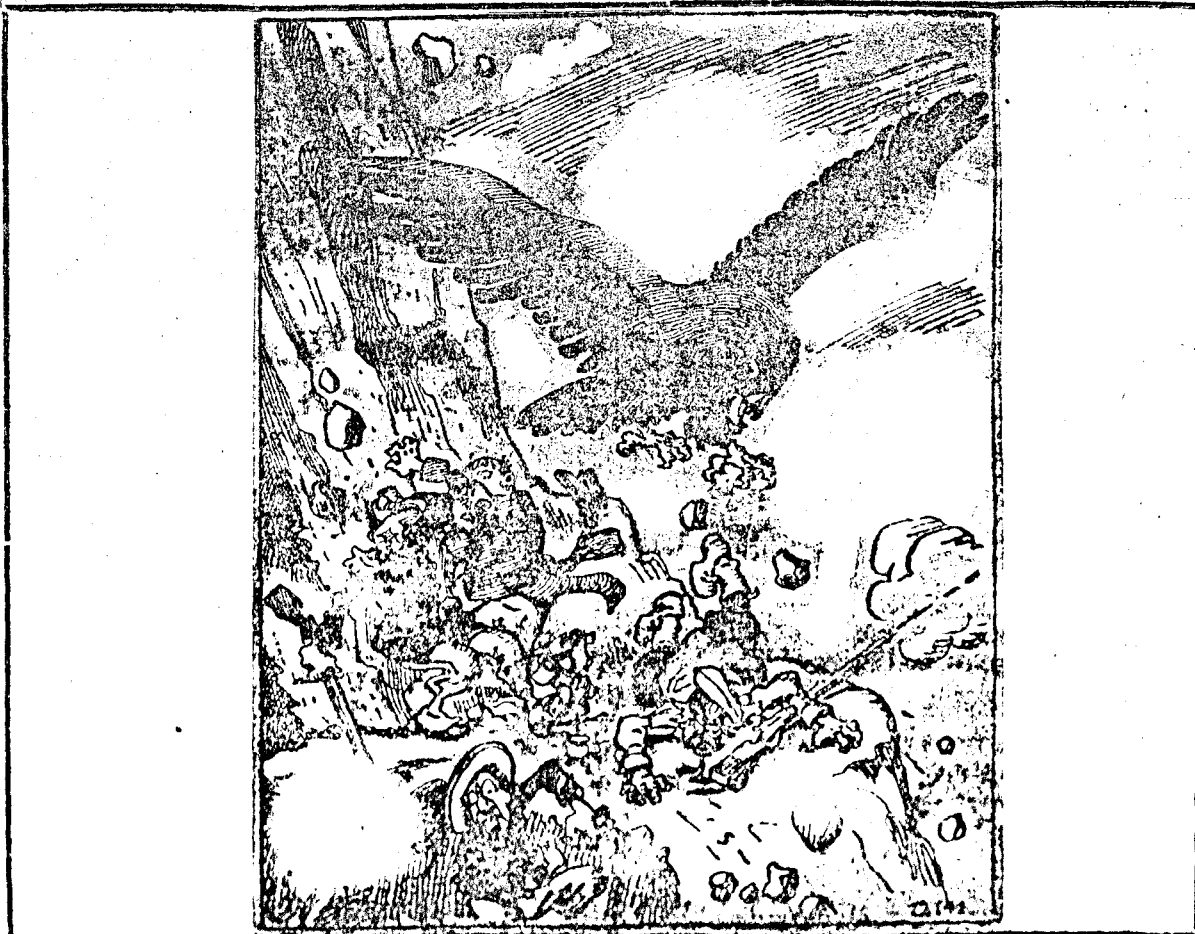
„Apoloția vulturului austro-german, care apărăvăt în prăbită alință Ententei. (Dătr'o ioristă germană)“

Și 'n loc de prunci și nevestă Cari cu dor să-l jeluască — Saniteții -- cari apucă În mâni lopeți, și-l astrucă, Și în loc de rămas bun Fum negru eșit din tuni, Mormântul să îl negrească Ca 'ndată să putrezească. Frunză verde de colie Dar acas a lui soție De astea nimic nu știe Și tot așteaptă să vie, Ci 'n zadar a lui soție Il mai așteaptă să vie, În zadar prunci cu dor Așteaptă pe tata lor, Căci al lor tată iubit Poate e'a și putrezit, Ei pe mama lor întreabă Când vine al lor iubit tată, Ea tot le spune cu bine Că acas tatăl lor vine, Dar ea iar cu dor ascuns Așteaptă după răsunis.