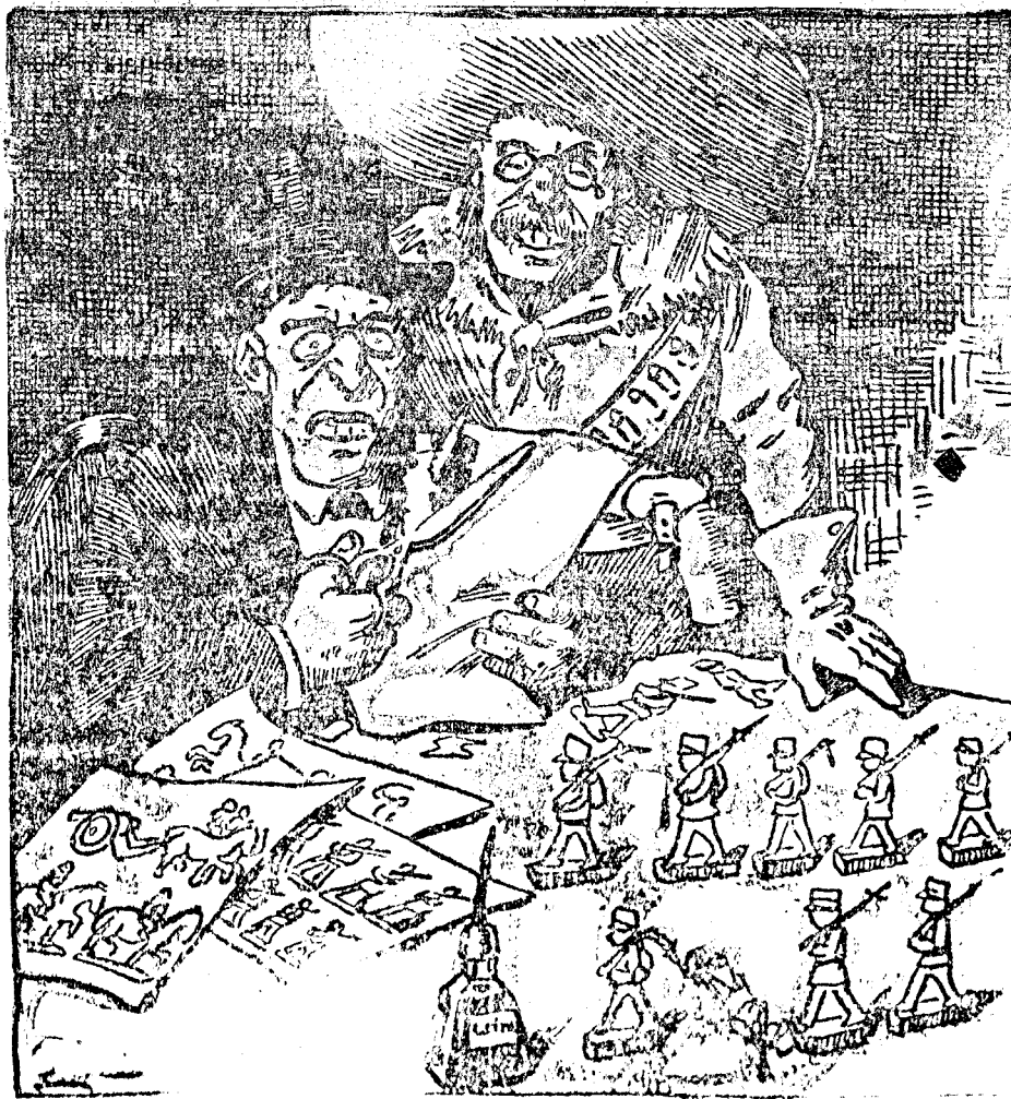
Cât de pregătit e acum Wilson de război — pe hârtie.

«De sigur, d. ex. nevasta mea acum se gândește că ce se-mi zică, că viu așa târziu acasă, iar și eu tot la asta mă gândesc.»