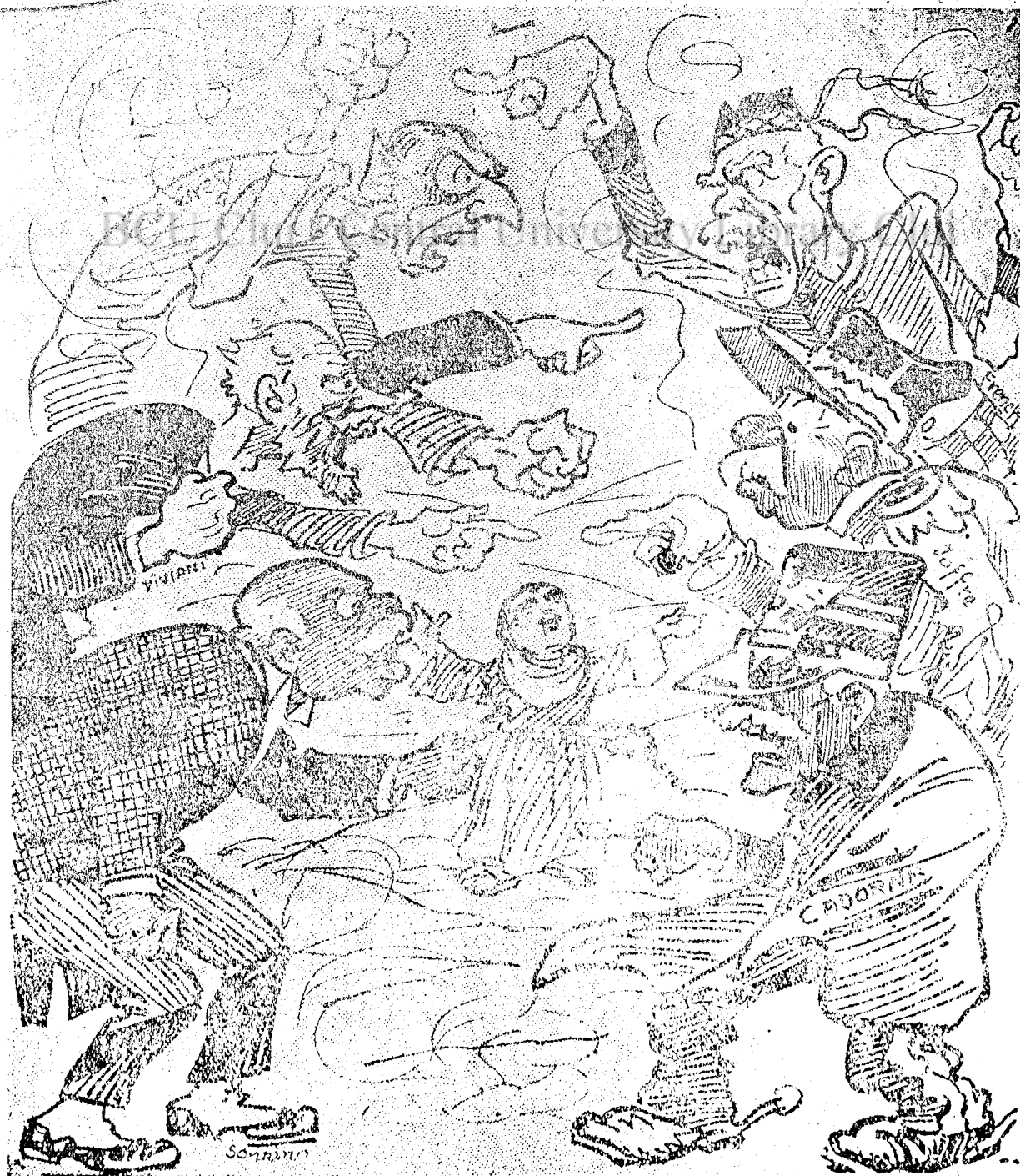
Ministrii Ententei învinuiesc pe generalii Ententei de înfrîngerile suferite, iar generalii Ententei, French, Joffre, Cadorna pun toată vina pe miniștrii Grey, Viviani și Sonnino.