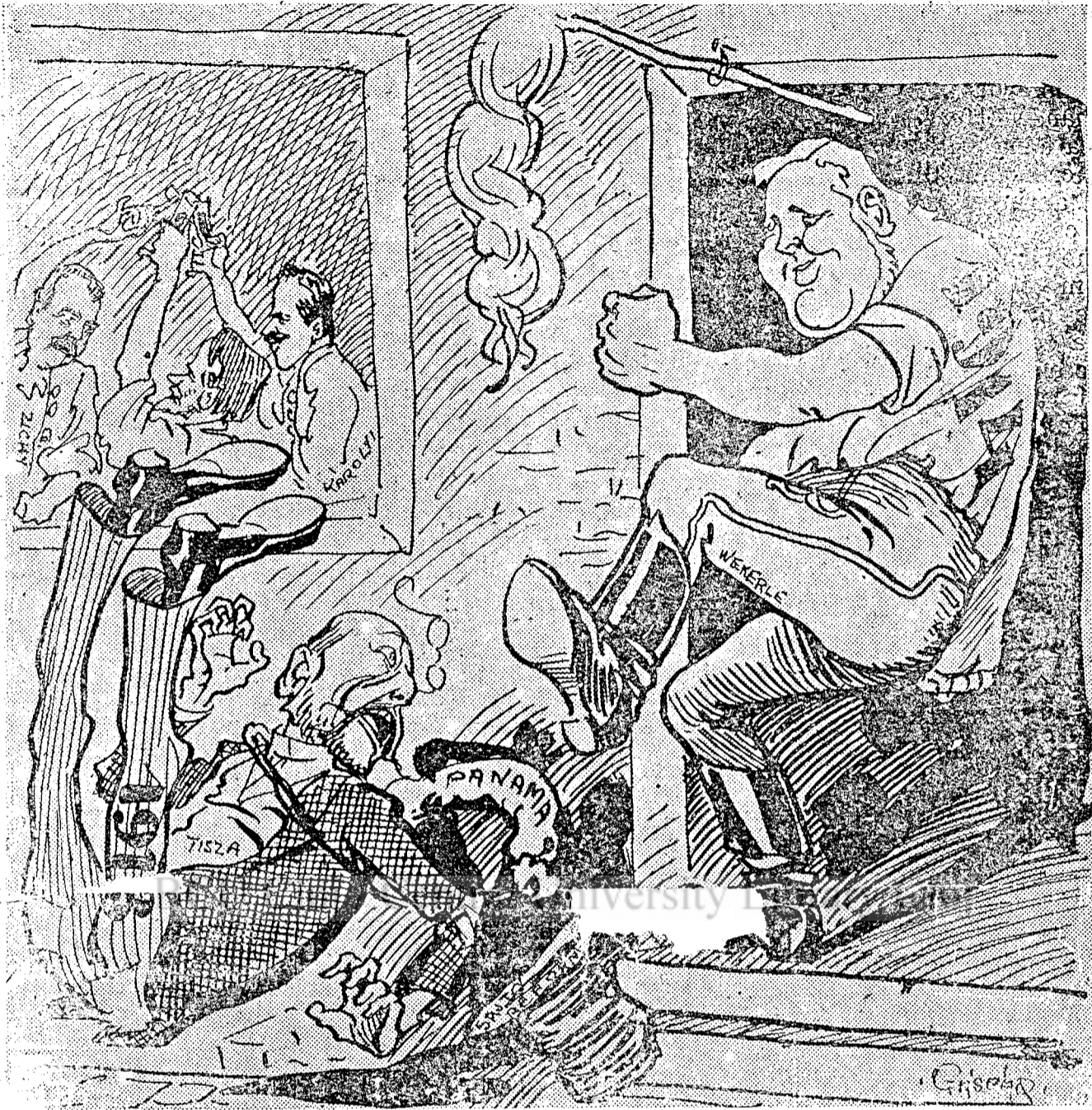
Birtașul wekerle: Cară-te de aici afară prăpăditule, ți-ai trăit traiul și ți-ai mâncat mălaiul.