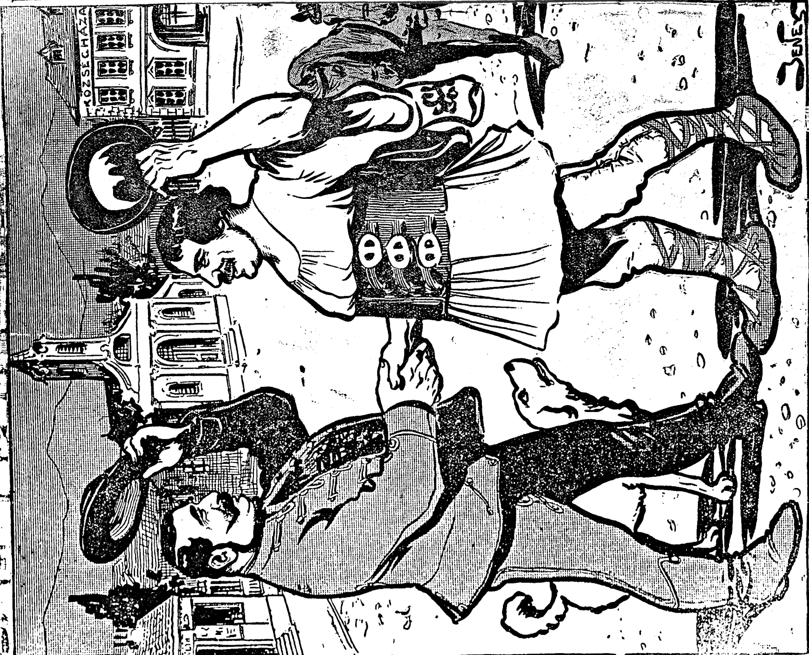
Când păcea și înțelegerea frățească stăpânește sufletele neamurilor din Ungaria: fericirea se arată în chipul mulțumirii și bunăstării desevășite, după-cum arată chipul de față.