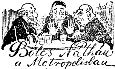
Bótes Nathán a Metropolisban