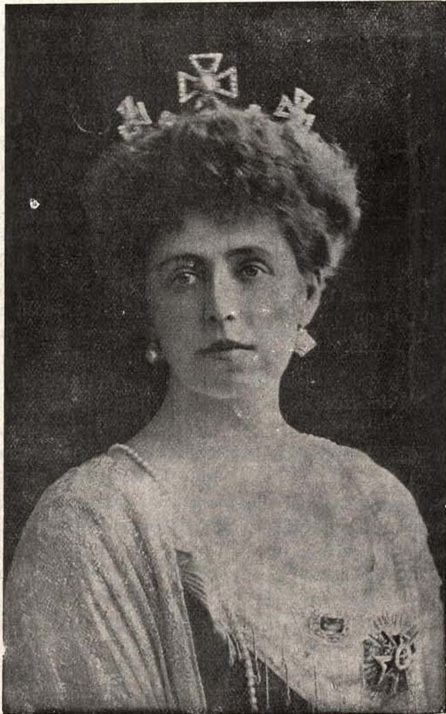
NOUA REGINĂ A ROMÂNIEI: MARIA