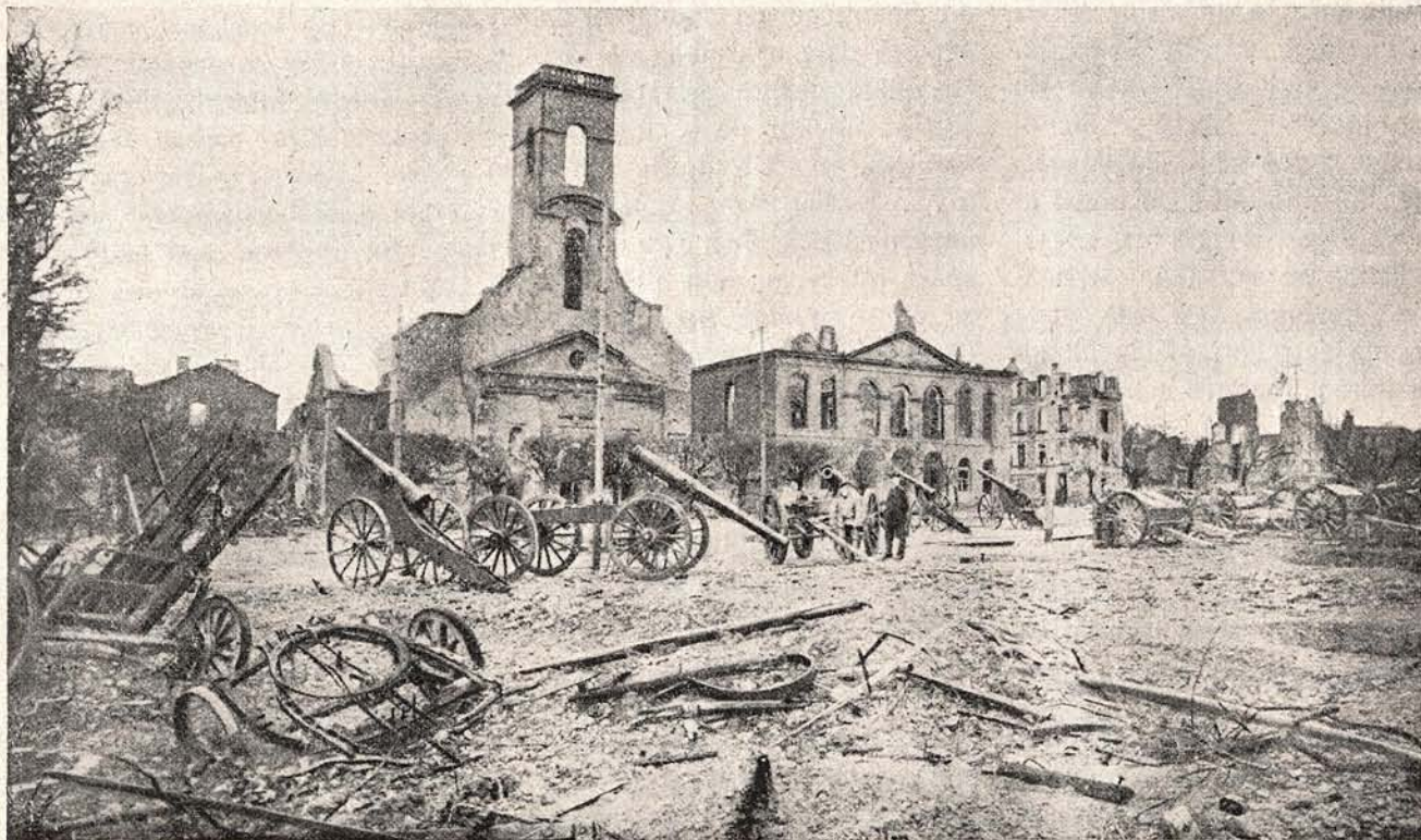
Altă vedere din orașul francez Longwy, tot zdrobit de artileria germană în acest războiu.