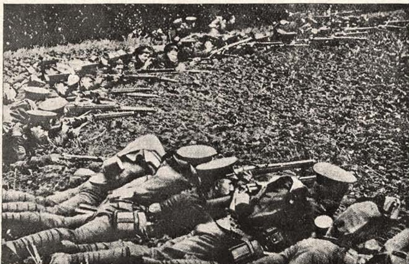
Infanterie engleză, în luptă.

fără nici o valoare, ori de foarte puțină valoare erau cumpărate pe întrecute și pentru sume de necrezut. Pentru bani rusești , s'au dat prinsonierilor prețuri terifiante. Eră adevărată bursă de suveniruri rusești și eră rușine să nu aibă omul măcar o rublă rusească.