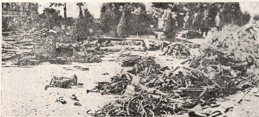
După lupta dela Longwy (în Franția) sfârșită cu zdrobirea orașului, — așa au rămas clădire pe grămadă sfărâmate în un parc al orașului tunuri, cară de muniții și alte lucruri de războiu, cum se văd în acest chip.

stricate de cătră Ruși firele telegrafice. După ce năvălitorii au fost alungați, impiegații noștri de telegrafie, le refac.