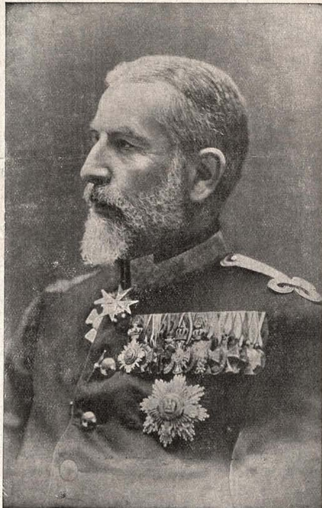
VECHIUL REGE AL ROMÂNIEI: CAROL †