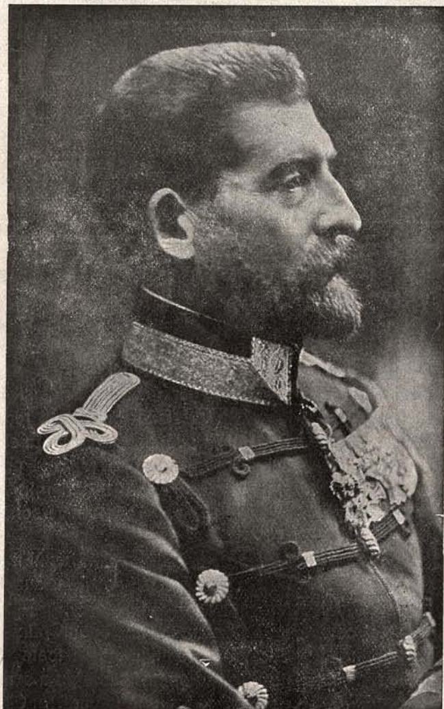
NOUL REGE AL ROMÂNIEI: FERDINAND I.