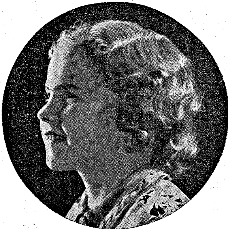
Fiica ascultă, privește și imită. Deci atenție, mamă!

Din acest punct de vedere judecând lucrurile, găsim că cel dintâi și cel mai valoros învățător al copilului este și rămâne tot mama. Influența ei în educație este cea mai puternică și cea mai întinsă. Cea dintâi ocazie de a forma caracterul și se oferă mamei. Buna sau reaua creștere se află în cea mai mare parte în mâinile ei. Deci, de ea depinde salvarea sau pierirea copilului. Se vede că Loida, bunica lui Timotei, și Eunice, mama lui, își dădeau bine seama de chemarea și răspunderea lor. Ele și-au dat toate silințele ca să dea acestui copil încă de mic o educație aleasă, ele însăși fiind însuflețite de o „credință neprefăcută”, pe care au semănat-o și în inima lui Timotei, și pe care continuu i-o alimentau cu învățătura sănătoasă a Cuvântului lui Dumnezeu. Referindu-se la o astfel de creștere îngrijită, apostolul Pavel îndemna pe Timotei, zicând: „Tu să rămâi în lucrurile pe cari le-ai învățat și de cari ești deplin încredințat. căci știi dela cine le-ai învățat: din pruncie cunoști Sfintele Scripturi, cari pot să-ți dea înțelepciunea care duce la mântuire, prin