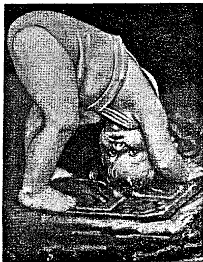
Ora de gimnastică.

Ținut astfel departe de flacăra dragostei de mamă, singura în stare să ardă sămânța răului prins de firea copilului, el rămase prins în mreaja feluritelor viții și apucături josnice, mai ales că se întâmplase ca însuși dascălul lui să fie stăpânit de patimi urite. Aceea care ajunsese