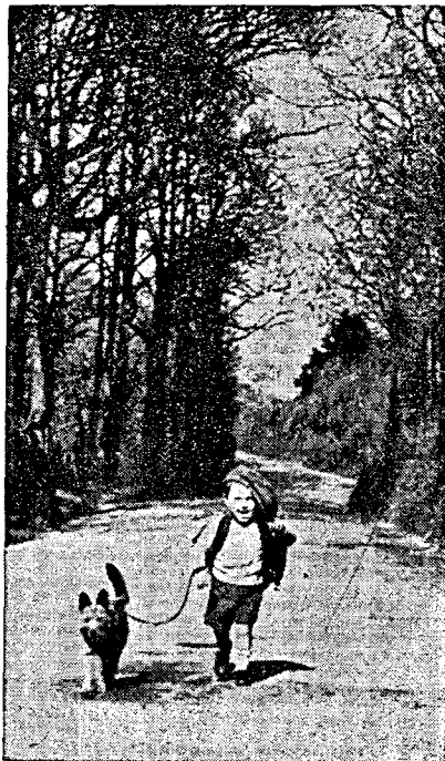
Doi prieteni la plimbare.

Mai întâiu, având încredere în el. Nimic nu-i ajută mai mult, decât să știe că există cineva care să fie sigur că el face tot ce-i stă în putință și că este extrem de capabil. Dacă noi avem cea