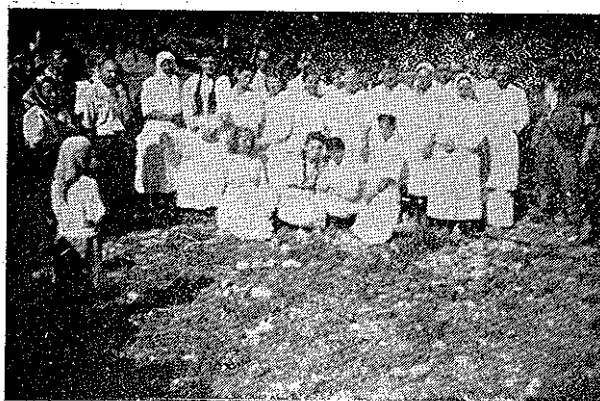
Botezul al 2-lea în comuna Maidan jud. Caraș cu 23 suflete executat de fr. Isbașa și fr. Caraman din București la o săptămână după conferința pe țară frățească. Domnul să-i binecuvinteze pe cei ce au încheiat legământul pe toată viața al servii lui

Ploaia binecuvântării Astăzi noi o așteptăm, Nu ne da nici când uitării, Căci pe Tine te căutăm.