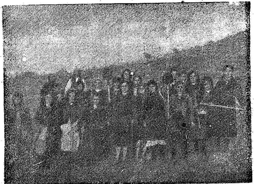
Poporul participă alături de Armata sa la construirea fortificațiilor Victoriei