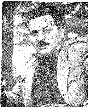
Locotenent General GUSIAS

COMANDANȚII AI ARMATEI DE MOCRATE A GRECIEI