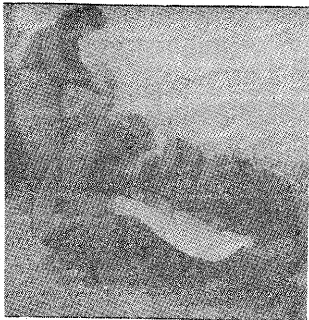
Luptătoare din Armata Democrată urmăresc pe hartă mersul operațiunilor.

Așa dar încetează soldatele, de a te omorî pentru aceștia.