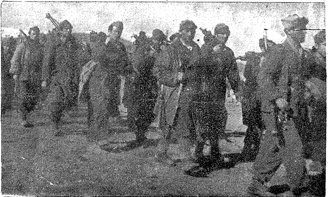
Luptători din Armata Democrată a Greciei