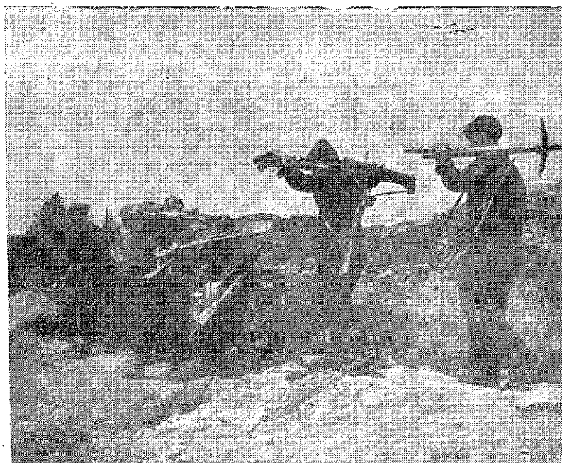
O Unitate a Armatei Democratice în marș.

Comandamentul General al Armatei Democratice a Greciei.