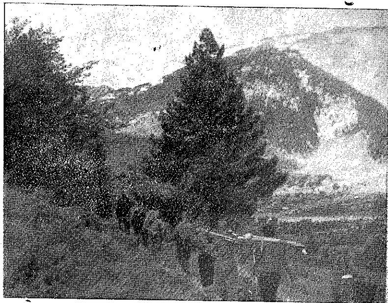
Luptători dintr'o unitate a Armatei Democratice în marș pe glorioasele înălțimi dela GRAMMOS.