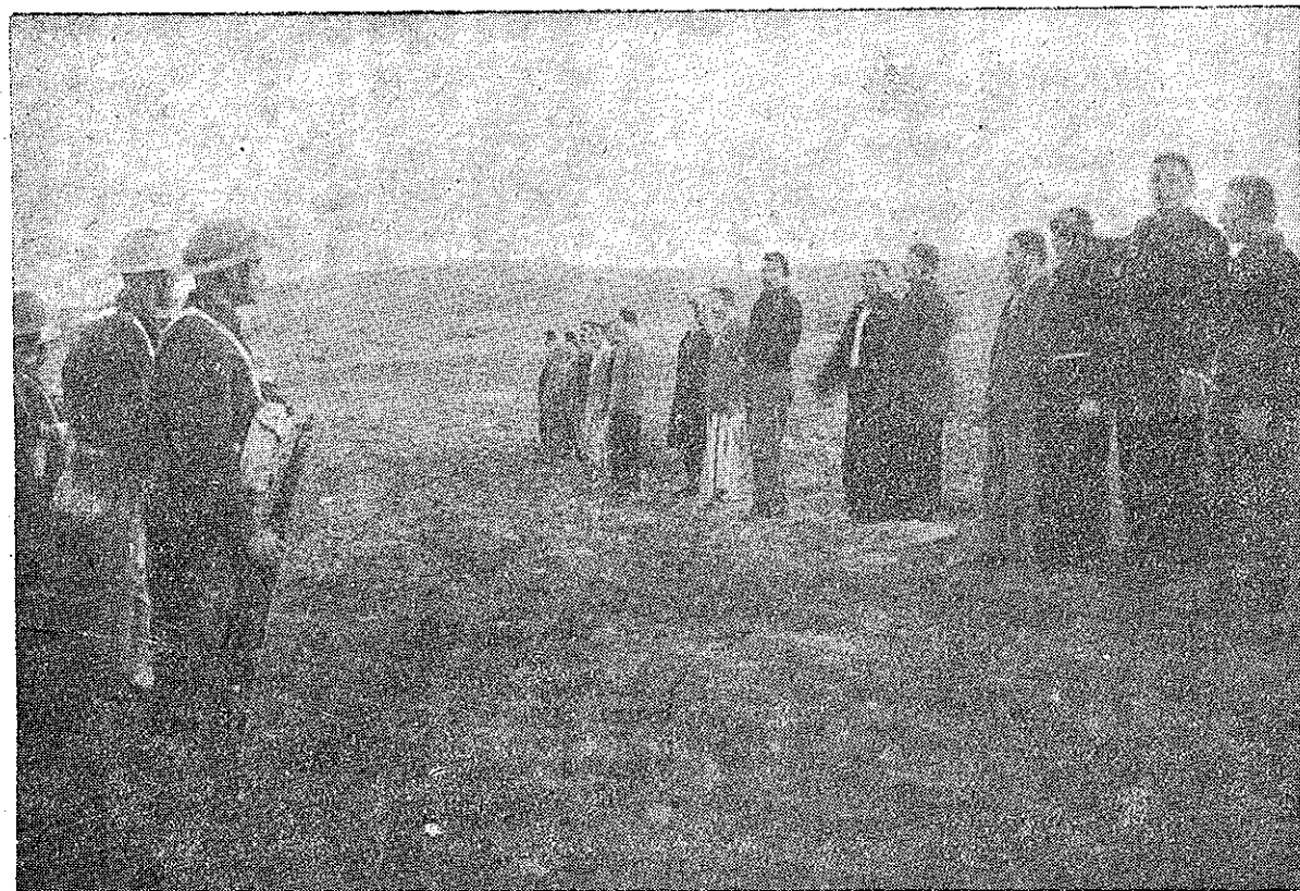
Patrioți greci în fața plutoanelor de execuție a regimului criminal monarho-fascist.

Dela Biroul de Agitație a Parti- dului Agrar din Grecia, secția Epir