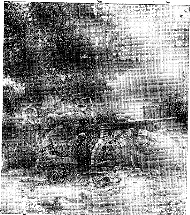
Pe prima linie a frontului.

Comandamentul General al Armatei Democratice a Greciei.