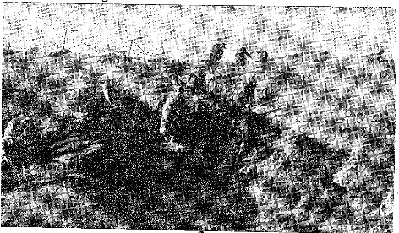
Asalt împotriva liniilor dușmane.

Comandamentul General al Armatei Democratice a Greciei.