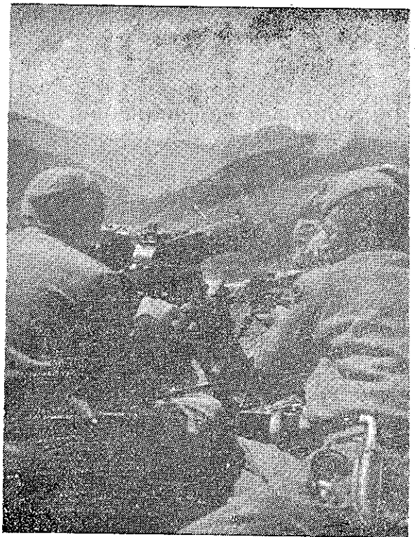
Luptători din Armata Democrată, pregătesc tirul împotriva armatei mercenare monarho-fasciste.

Comandamentul General al Armatei Democrate a Greciei.