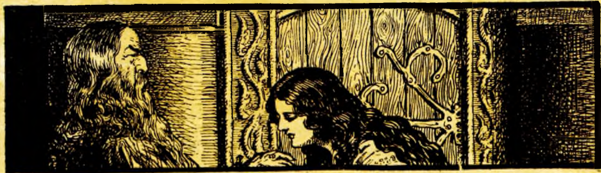
Doamna Ruxanda ieși după ce iarăși îi sărută mâna.