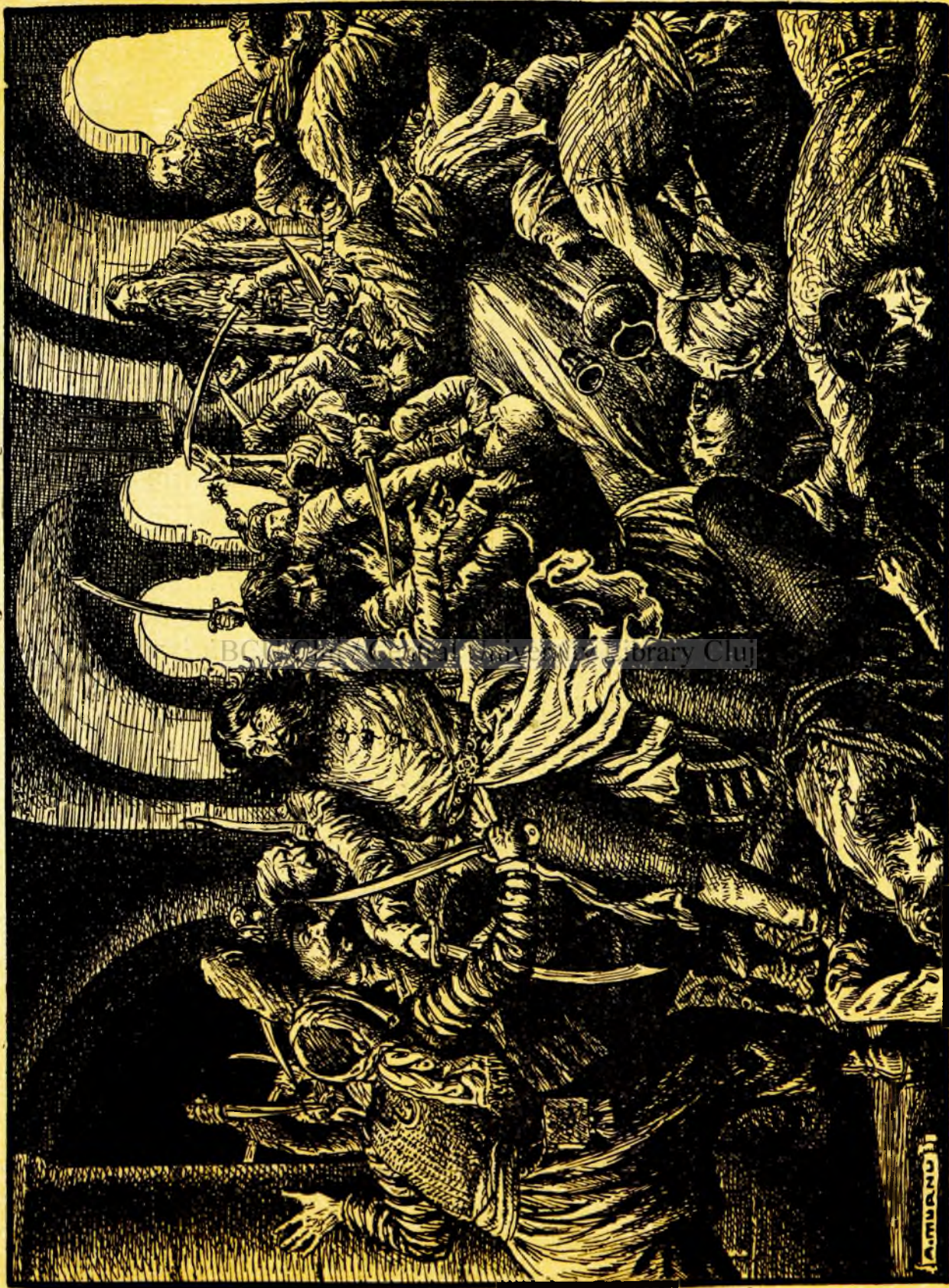
Toți slujitorii de pe la spatele boicilor, scofând junghiurile îi loviră.