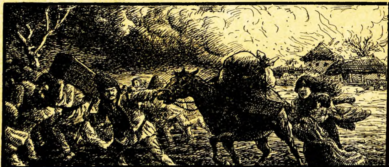
Lăpușneanu umplu cu lemne cetățile și le arse...

în care el nu avusese vreme a-și desvâli urâtul caracter.