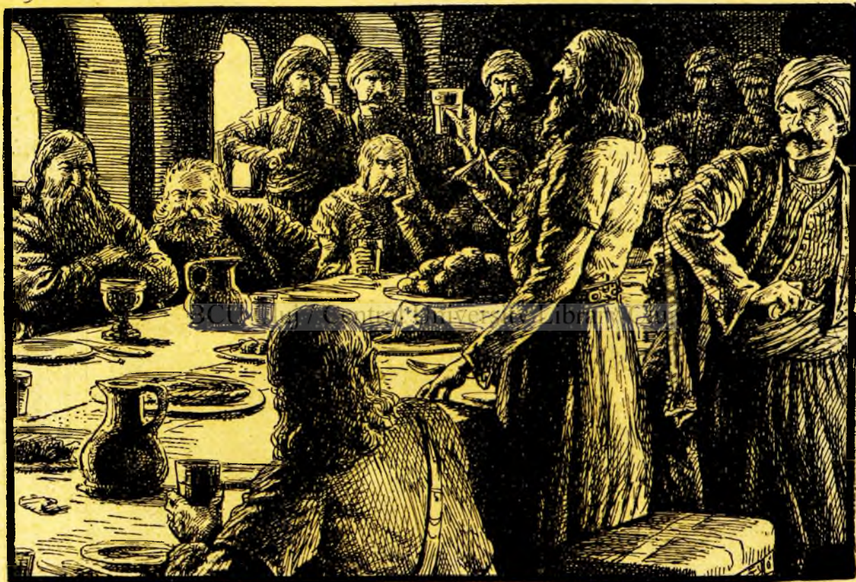
Veveriță ridică paharul închinând...

Odată cu omorul de sus, începuse uciderea și în curte. Slugile boierilor văzându-se lovite fără de veste de sol-