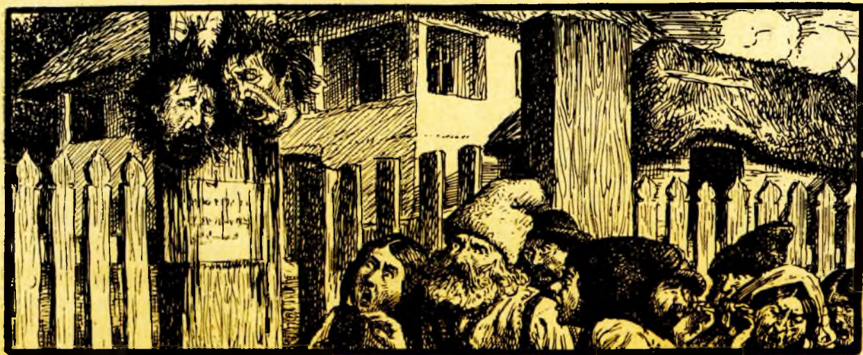
Capul vinovatului se spânzura în poarta curții...

Peste zobonul de sfoară aurită, purtă un benișel de felendreș albastru, blănit cu samur, a căruia mânice atârnavă cu mari paftale de matostat, împrejurate cu pietre scumpe; iar pe grumazii ei atârnavă o salbă de multe șiruri de măr-găritar. Șlicul de samur, pus cam într'o parte, eră împodobit cu un surguciu alb și sprijinit cu o floare mare de smaragde. Părul ei, după moda de atunci, se împărțea despletit pe umerii și spatele sale. Figura ei aveă acea frumuseță, care făcea odinioară vestite pe femeile României și care se găsește rar acum, degenerând cu amestecul națiilor străine. Ea însă era tristă și tânjitoare, ca floarea expusă arșitei soarelui, ce nu are nimic s'o umbrească. Ea văzuse murind pe părinții săi, privise pe un frate lepădânduși religia, și pe celălalt ucis;