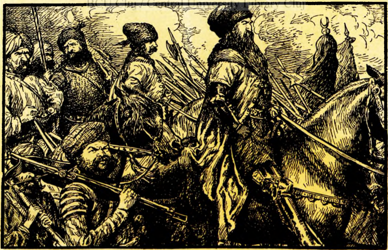
Lăpușneanul mergea alături cu Vornicul Bogdan...

— Au doar nu sânt și eu Unsul lui Dumnezeu? Au doar nu mi-ați jurat și mie credință, când eram numai Stolnicul Petre? Nu m'ați ales voi? Cum