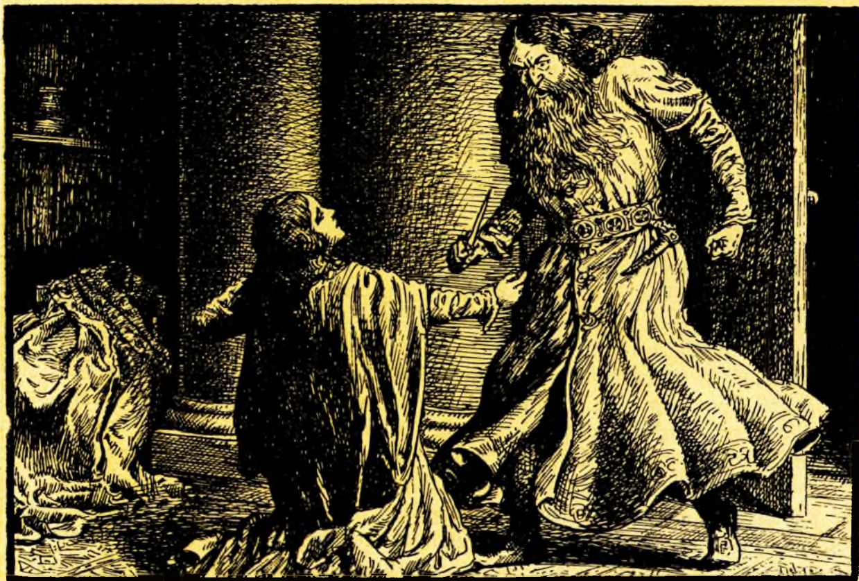
— Muiere nesocotită! strigă Lăpușneanul sărind drept în picioare.

și mai întâiu hotărîtă de obștie a fi soția lui Jolde (pe care nici îl știa), acum fusese silită de aceeași obștie, care dispoză de inima ei fără a o mai întreba, a da mâna lui Alexandru Vodă, pe care cinstindu-l și supuinându-se ca unui bărbat, ar fi voit să-l iubească, dacă ar fi aflat în el cât de puțină simțire omenească. Apropiindu-se, se pleacă și-i sărută mâna. Lăpușneanul o apucă de mijloc și ridicând-o ca pe o pană, o puse pe genunchii săi.