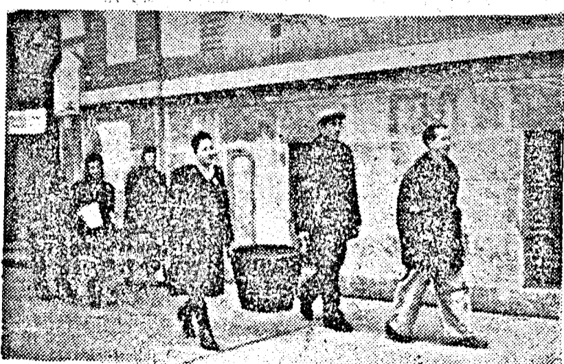
Vasárnap reggel a város minden részében gyűjtő-csoportok jelentek meg, amelyek a lakosság ajándékait vették át. Képünkön: a Horea uti elemi iskolából az egyik csoport munkába indul.