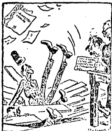
A francia reakcióssok a washingtoni vizsgálóbizottság előtt.