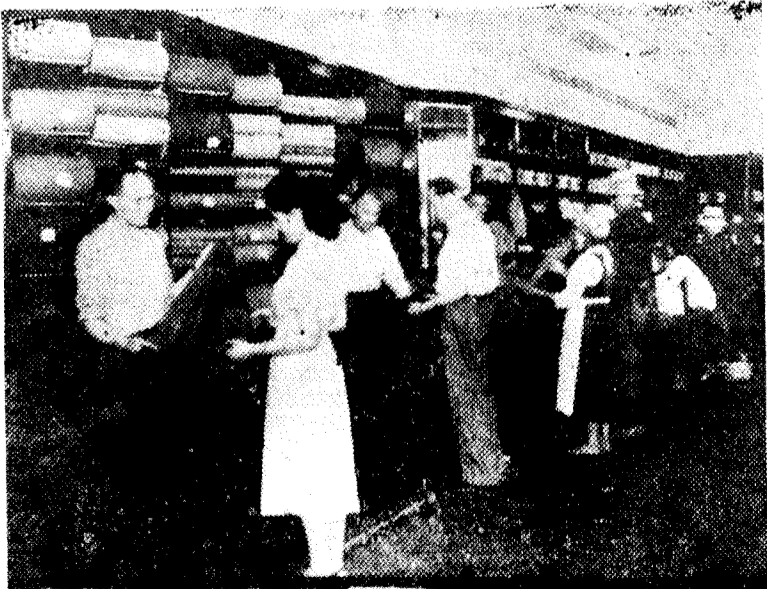
A Kolozsvár, Dózsa György-utcai 1. számú „Clujul” fióküzlet választékos és jóminőségű áruval látja el a város dolgozóit. Májusban a szövetségi kiadású 11.760 méter szövetet osztottak ki, 10.670.000 lej értékben.

Az előadásokat viták követik. Az üléseket Bukarestben, a Központi Egyetemi Könyvtár aulájában tartják.