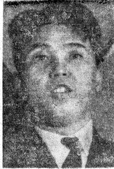
Kim Ir Szen, a koreai nép és hősiessé szabadságharcának vezetője

Az északkoreai városokban és falvakban egyre nagyobb mennyiségben tűnik fel ezekben a napokban egy színes plakát. Kínai hős önkéntes katonát ábrázol, háromszínű koreai zászlóval. Ez a falragasz már jelképpé vált: a kínai és koreai nép testvériségének jelképpé. Ezt másolja a koreai gyerekek, az asszonyok és lányok és minden kis ajándékhoz, amellyel a kínai hőseket üdvözik, mellékelik a testvériség jelképét. Ez a plakát hirdeti, hogy Korea népe a hős kínai önkéntesekkel együtt döntő csapásra készül. Olyan csapásra, amely a kezdetét jelenti annak, hogy teljesen megtisztítsák a koreai földet az intervenció csapatoktól. Korea népe telepleste a nemzetközi imperializmus agresszív terveit és most fele arán is megvédi a béke és a nemzetközi biztonság ügyét.