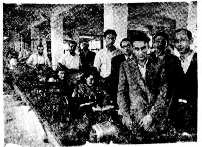
Új csucsszalag-rendszert vezettek be a „Flacara” konfekció-üzemben, amelynek segítségével 30 százalékos termelékenységnövekedést értek el. „Jobbra” az üzem technikusai láthatók, akik a szalagrendszer bevezetését kezdeményezték.