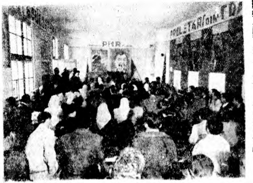
A kolozsvári állami porcelángyár dolgozói a kultúrteremben meg- rendezett nagygyűlésen örömmel jelentik be csatlakozásukat az ország- körű állományok versenykihívásához — Pártunk megalapítása 30. évfor- dulója tiszteletére