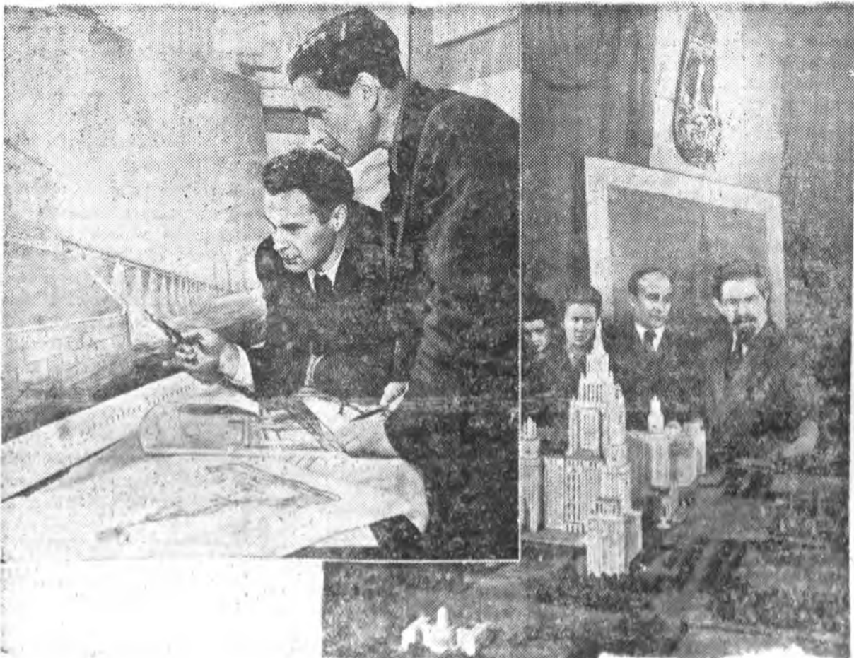
Baloldali kép: A kuzbicsovi vízierőmű tervrajza előtt