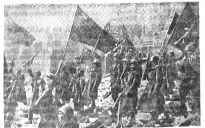
A „Berlin eleste” című hatalmas szovjet film egyik jelenete a német fasizmus szétzúzásának egyik végső mozzanata.