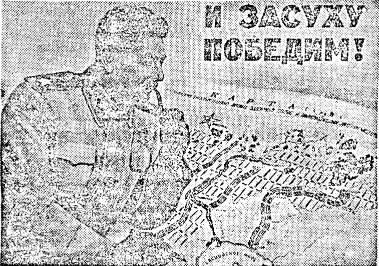
„AZ ASZALYT IS LEGYŐZZÜK” (Govorkov szovjet festő műve).

A „Lenin utja” kolhoz Lurgonya és főzelék termelésének növekedése szorosan összefügg az öntözési rendszer megteremtésével. Az öntöző csatornába a közeli folyóból villamosmotor szivattyuzza a vizet. Ugyan-