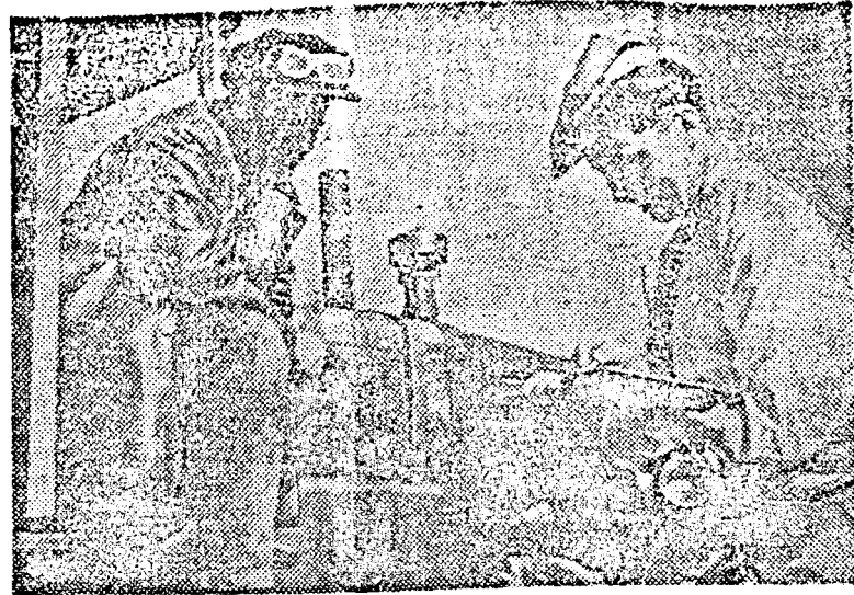
A „Partizán” kolhoz elnöke részletesen megbeszéli a traktorista brigád vezetőjével a tavaszi szántási tervet.

A Szovjetunió államgyümölcsfajta-osztályozó bizottsága a napokban igen jó véleményűt adott P. A. Dibrikov kertész által Ural és Szibéria részére kitenyészített új fajta almáról. Ez az almafajta kicsiny, legfeljebb 60 grammos, igen jóízű gyümölcsöt hoz. A Dibrikov-féle almafa gyümölcse rendkívül korán érke és igen nagy mennyiségben terem. Az új fajta almafa az oltás után első évben már termést hoz, míg a közönséges almafaják csak 3-4 év múlva kezdnek gyümölcsöt adni. Dibrikov almái jól bírják a hideget és ellenállnak a természet szélsőségeinek, ezért igen komoly értéket jelentenek az urali és a szibériai gyümölcsösök számára.