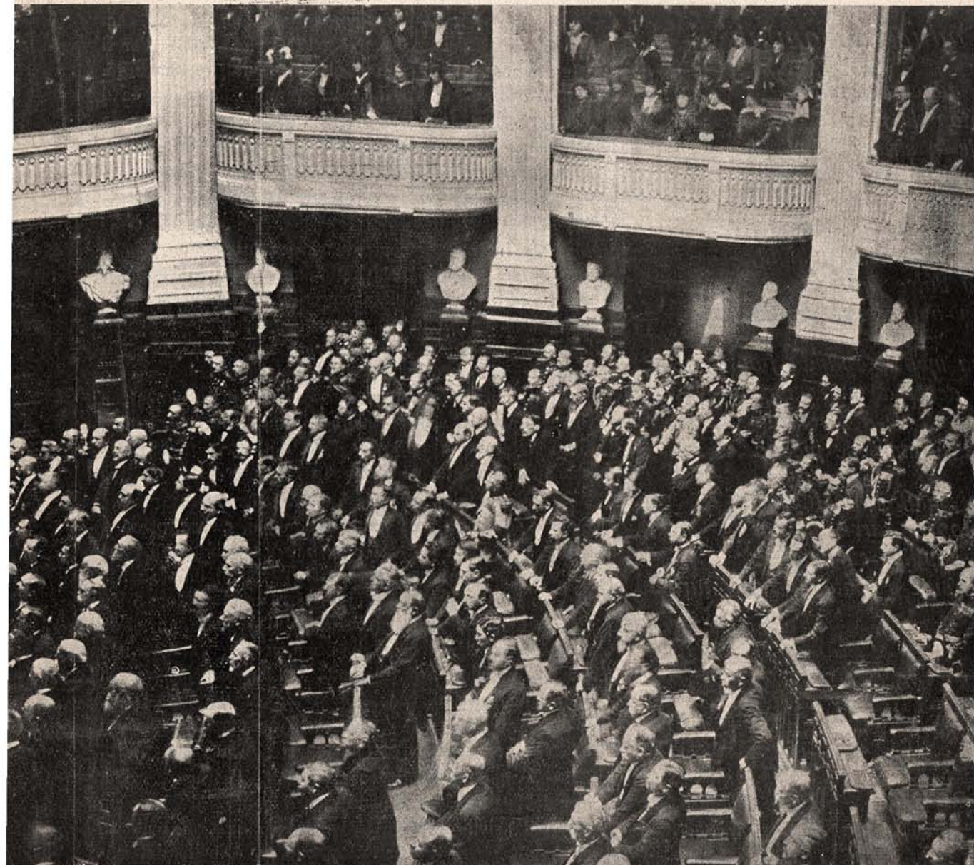
imi depunerea jurământului noului Rege Ferdinand I., din privilegiul urcării Sale în Tronul Țării. — Regele se așază pe tron și a Ministrilor și înaintea întregii Mari Adunări. — La spatele Regelui se vede Principele de Coroană, Carol.

franceză nu izbuțește să-și deschidă drumul nici măcar spre una din vestitele „ Bocche din Cattaro ” (Gurile Cattaro-lui). Tot ce s'a putut ajunge până acum e, distrugerea prin bombardare a unuia din forturile cari stăpânesc portul și formează linia de apărare al acestuia. Succesul acesta parțial nu e datorit atât flo-tei, care e împiedecată în acțiunea ei de mine submarine , cât bateriei de asediu formată din tunurile mari debarcate de Francezi la Autivari și urcate de Muntenegreni pe muntele Lovcen . La acțiunea combinată a vaselor de războiu și a artileriei de pe uscat a participat și un aeroplan, care mai înainte distrusese o parte