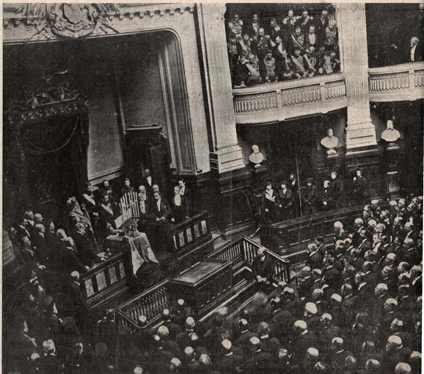
Adunarea Națională a României. Deputații și senatorii, întruniți în 28 Sept. v. 1914, la București, pentru a vedea la stânga în fața unui sfeșnic cu șapte lumini, rostind jurământul în ființa de față a Metropolitului Primat a

milion de oameni. Dacă înrolarea voluntarilor nu se va face cu graba dorită, Lord Kitchener , ministrul de război, va cere Parlamentului votarea unui proiect de lege, prin care se va introduce și în Anglia serviciul militar obligator , care astăzi nu există în Anglia. Deocamdată însă, se spune, nu e lipsă de aceasta. Cât despre trupele din colonii , probabil că nu vor mai fi aduse în Europa, pentru că Anglia va avea acum lipsă de ele și pe acolo.