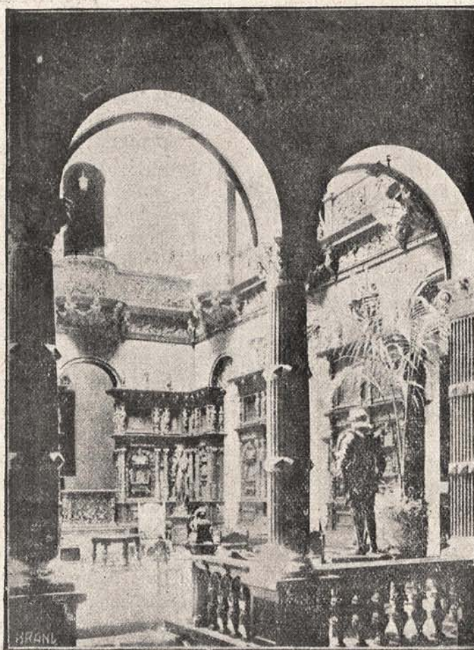
Altă vedere din lăuntru Castelului „Peleş“.