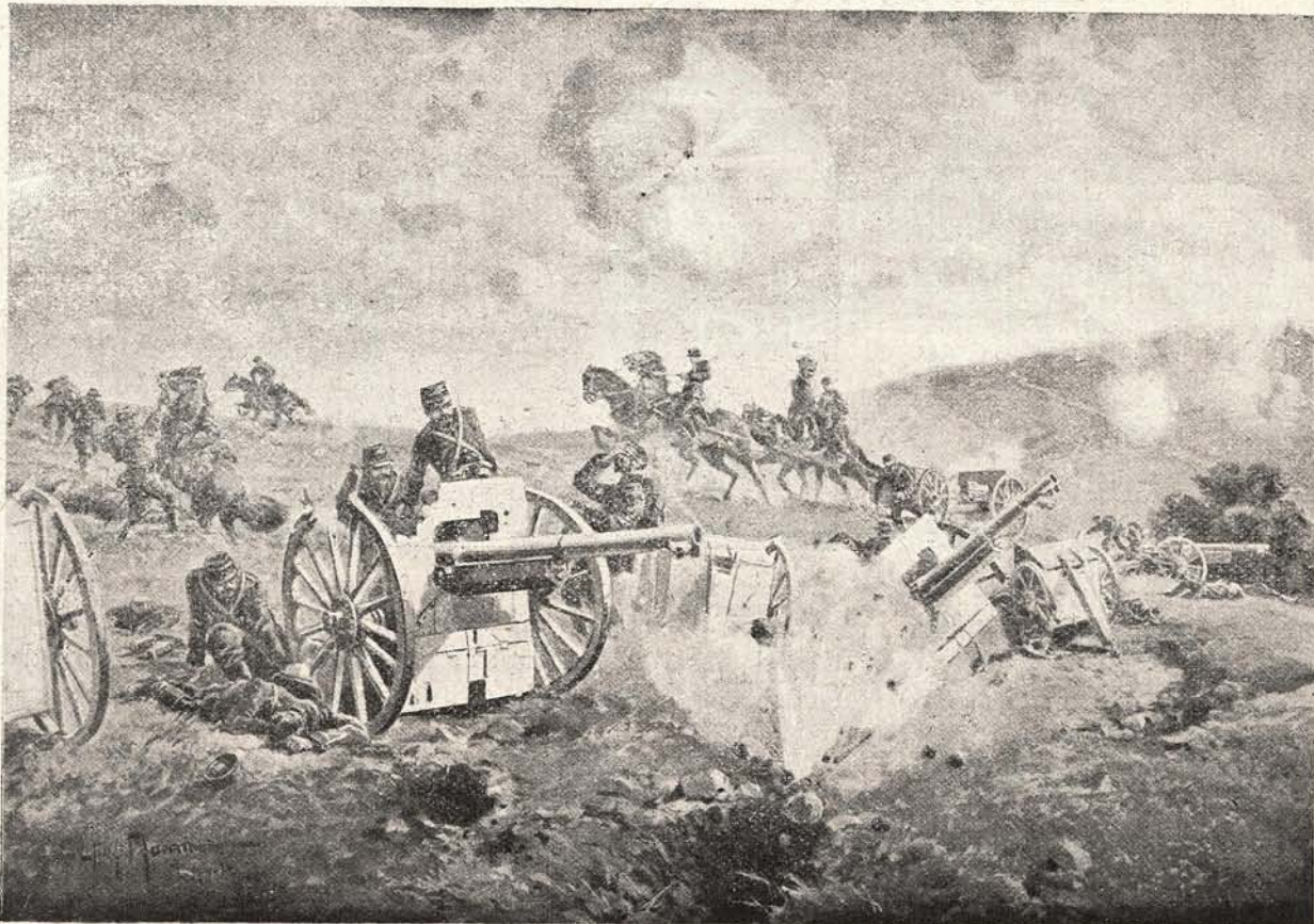
După un cumplit duel de artilerie: Tunuri zdrobite, cai și călăreți speriați, căutându-și scăparea, — căci inimicul le-a descoperit așezarea și nimerește asupra lor.

putea stăpâni, instinctiv mă trag cătră perete și aștept. Săsăitul dureros al granatei îmi pare ceva supranatural, ceva fantastic, ceva, ce-ți prevestește rău. Abia înceată săsăitul, o explozie groaznică cutremură văzduhul și imediat pereții se desprind, se leagănă și-apoi bat înfiorător pământul, urmează apoi plezniturile de cărămizi și șindile ce cad, cari fac un zgomot întocmai ca țiglele ce le asvârlă de sus pe o piatră. Bucățile înfierbântate ale granatelor, întocmai ca ploaia de grindină, bat toate celelalte părți rămase până acum intacte ale clădirilor.