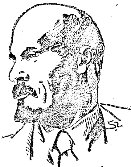
Vladimir Iljics Lenin

Hatalmas keleti barátunknak és szövetségeseinknek, a szomszédos Szovjetunió népnek január 21-én immár huszonharmadszor tűzik ki halálának emlékére a gyászlobogókat. A Szovjetunió két nemzedékének sóhaja, az illusztrált embernek az emlékéhez, száll a legszörnyűbb, a legsötétebb elnyomás alól vezette őket a szabadság felé. A két nemzedék közül az egyik vele harcolt a cári zsarnokság ledöntéséért és az új világ megteremtéséért. A másik már abba a szabad és becsületos világban született, amelyet az ő lángszelje hívott életre és amelyben ember embert, nép népet már nem nyom el.