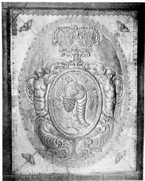
Apaffi Gergely címere 1666.