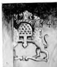
Szűcs czéh jelvénye 1684.