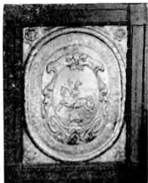
Ebeni István címere 1681.