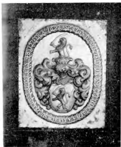
Székely László címere 1692.