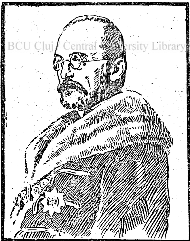
Gróf Tisza István.

A nemzet azonban nem értette meg lángeszű és törhetetlen buzgalmu fiát. Kis lelkek elvakult tömegeket állítottak utjába, hiábavaló, emésztő harcokat idéztek fejére. A szent akarat a ma-gyar átok sulya alatt nem tudott kibonta-kozni, történelmi balvégzet és emberi rövidlátás eredmény-telenségbe fulasz-tották a legnemesebb lélek törekvéseit és így következett el az ítélet, amely min-dent megsemmisi-tett, amiért Tisza István a bölcsök ta-lárját, a hősök kard-ját és a vértanuk keresztjét nemzete