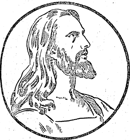
A GECSEMANÉ KERTBEN.

Kínos csend, ijesztő árnyak, a földi óra éjfélbe haladt... sejtő, fagyasztó halál-suttogás... Krisztus van ébren az alvó fák alatt.