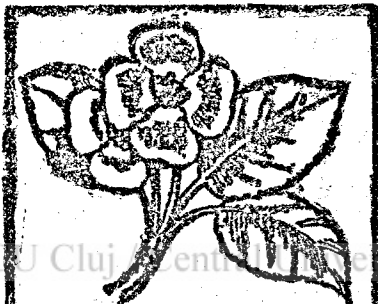
PERMETEZÉS MEG KORAI

százalékos szulfarol oldattal való permetezés. A permetezést akkor végezzük, mikor a bimbók éppen hogy felpattantak, de a virágban levő bimbó még nem váltak szabadokká. A permetezést két-három hetenként gyengébb oldatokkal meg-