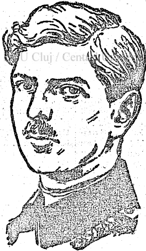
II. Károly király.

Minket magyarokat az általános helyzet alakulásán kívül az is érdekel, hogy II. Károly király milyen érzéssel fog viselkedni az ország kisebbségei iránt. Követelni fogja-e a kormányaitól, hogy anyagi és erkölcsi értékeink fölprédálásai megszűnjenek? Érvényt fog-e szerezni a