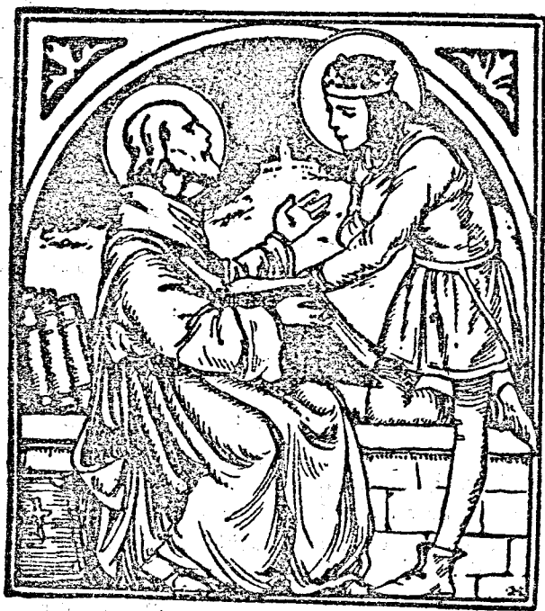
Szent Gellért tanítja Szent Imrét.

hogy milyen szeretettel és lelki bensőséggel nevelték. A keresztségben Heinrichusz (Henrik) nevet adtak neki, anyai nagybátyja, a később szintén szentté avatott II. Henrik német király és római császár után. II. Henrik névből magyar ajkon idővel Hemrik—Emrik, majd Emreh—Imreh lett.