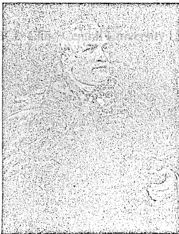
SZÁSZ DOMOKOS, az erdélyi reformátusok egyik nagy püspöke.

Régen a református papképzést is a kollegiumok végezték, amelyeket kollegiummá építettek, hogy az elemi iskolától a főiskoláig mindent magukba fog-