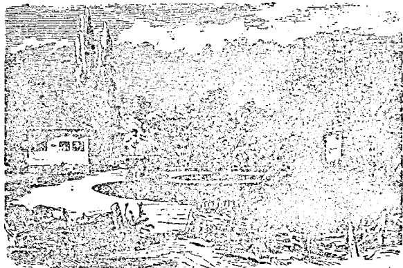
A Jósika család szurduki kastélya.

eligazította minden dolgát. Úr volt tehát, de olyan, mint minden igaz magyar úr: érezte, hogy alapja a népben van, hogy ő is e népből való.