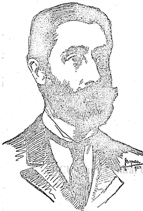
Báró Jósika Sámuel férfikora delén.

kellett volna a munkától. Orvosa eltiltotta tőle, mi pedig kértük: kimélje magát. Nem hajtott reánk. — Nem az első Jósika leszek — mondotta — akit a közügy szolgálata közben ér a halál.