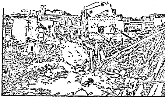
ROMBADOLT. HÁZAK MESSZINABAN

Nálunk Európában a gyakori földrengés Dél-Olaszország átka. Legutóbb 1908 december 28-án reggel 1/46 órakor rengett itt meg a föld s pár pillanat alatt Messzina városa, melynek