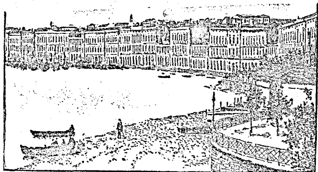
MESSINAI TENGERPART A FÖLDRENGÉS ELŐTT

Beszámoltunk utóbb arról a nagy földindulásról, mely mostanában Dél-Amerikában pusztított. Csile állam tengerparti része rengett meg mintegy 600—800 km. hosszúságban, s mint a legutóbbi híradások mondják, körülbelül 35 ezer ember pusztult el, sőt a földrengés hatása alatt a tengerbe süllyedtek állítólag a Husvét szigetek is, melyek pedig e partoktól befelé a csendes Óceánban kerekén 4000 kilométerre fekszenek.