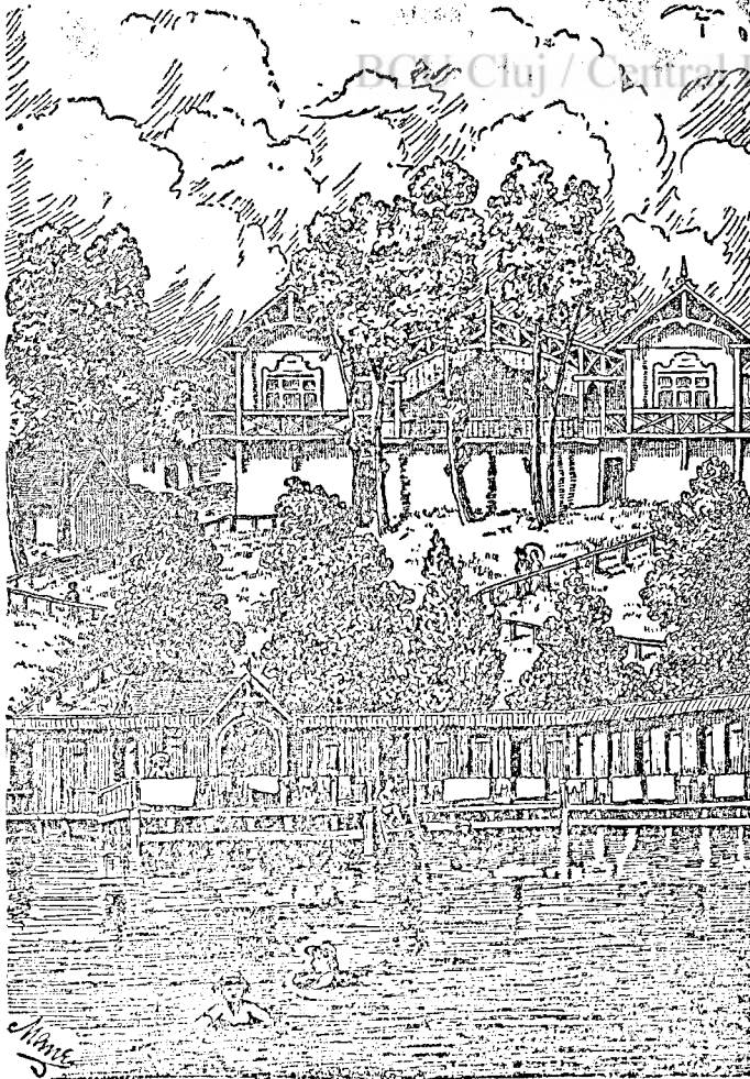
SZOVÁTA FÜRDŐ. A MEDVE TÓ.

Marosvásárhelyen egész lélekkel állt a székely ügyek szolgálatára. Kezdte a székelyföldi fürdők és köztük elsősorban Szováta ügyének felkarolásával. Szóvátát ő állította világ fürdővé fejlődés útjára. És mintegy jelképezi a fürdőügy terén kifejtett tevékenységének irányát az a tény, hogy 1902-ben az első székely kongresszust az ő elnöklete alatt éppen Szováta tartották