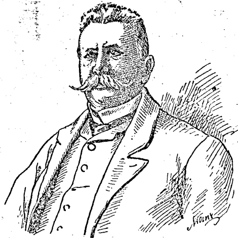
SÁNDOR JÁNOS VOLT MAGYAR BELLÜGY-MINISTER.

Sándor János ez irányban érvényesült művészeiét különösen próbára tette az a változás, mely 1901-ben Kisküküllő megye éléről elszólitva, Marostorda vármegye főispáni székébe hívta. És Sándor János ezt a próbát is kiállotta. Székely ember volt, a csikszentmihályi Sán-