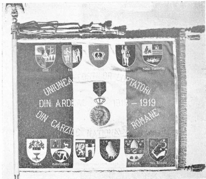
O parte a Drapelului Asociației, sfințit la Alba Iulia, la 1 Dec. 1940. reprezentând stemele celor 23 de județe.