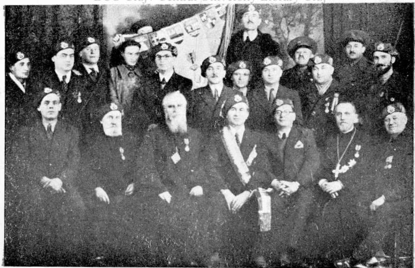
Delegația Asociației Gărzilor Naționale la sfințirea drapelului. (Alba-Iulia, 1 Dec, 1940)