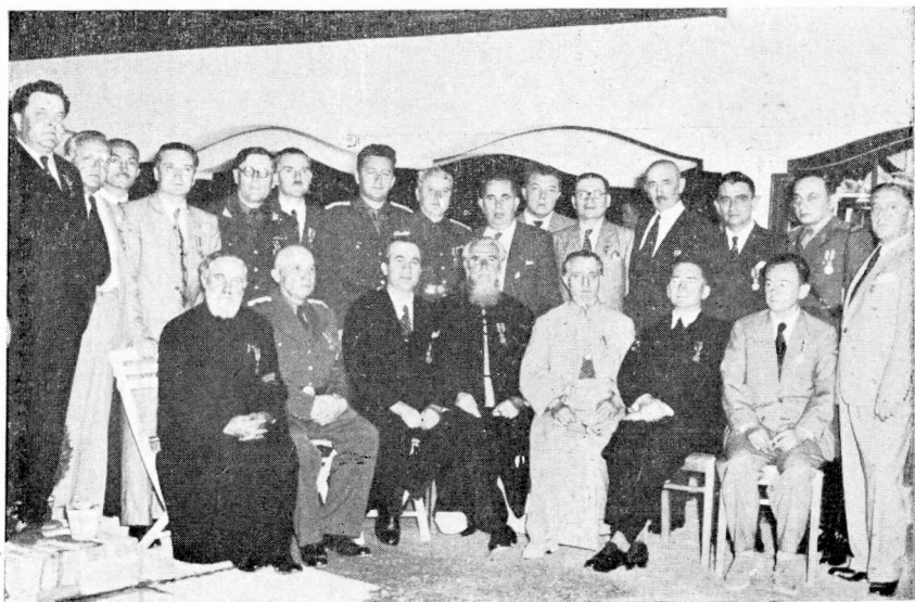
Serbarea decorării cu «Medalia Ferdinand I cu Spade» a unui grup de camarazi din Capitală, la 25 Iulie 1940.