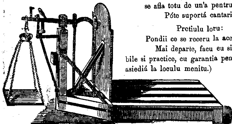
Cantariu decimalu cu podu in patru coltiuri