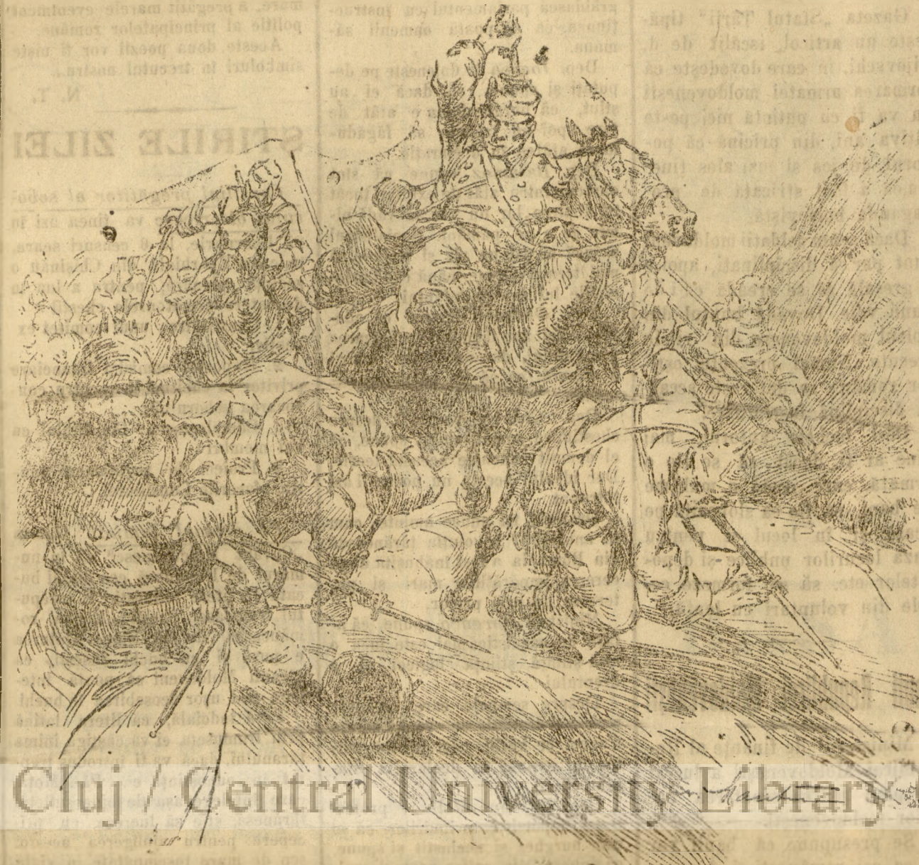
Românii au avut din cele mai vechi timpuri oștișă călărească, care a câștigat multe biruințe. În războiul de astăzi, cavaleria României a dovedit din nou în lupta cu dușmanul, că știe să se bată cu același avânt și îndrăzneală care i-a adus recunoștința neamului și lauda străinilor. Astăzi sabia călăreștilor noștri nu mai fulgeră peste capetele Nemților, căci vânzarea Rușilor a adus-o la neputință.