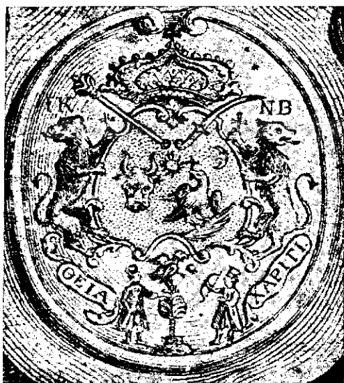
Fig. 1 (mărită de două ori).

În special primul fanariot, Nicolae Mavrocordat, a ținut foarte mult să arate supușilor săi, că se trage, măcar în linie femeiască, din via «Domnilor Daciei» și că se înrudește în acelaș timp cu «despoții crăici sârbești» și cu «Iaghelonii ai celei leșești».